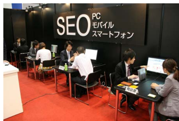
(2011年5月開催 web&モバイル マーケティング EXPO【春】会場風景)